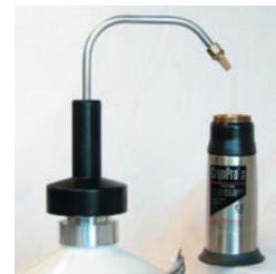
Abfüllprozess mit Druckaufbaufunktion

Die Investition für diese sehr hochwertigen Behälter liegt z.B. bei 50 l Behältern bei ca. € 3.000,- und bei 300 l Behältern bei ca. € 5000,-. Größere liegende Behälter z.B. 1000 l bis zu € 20.000,-